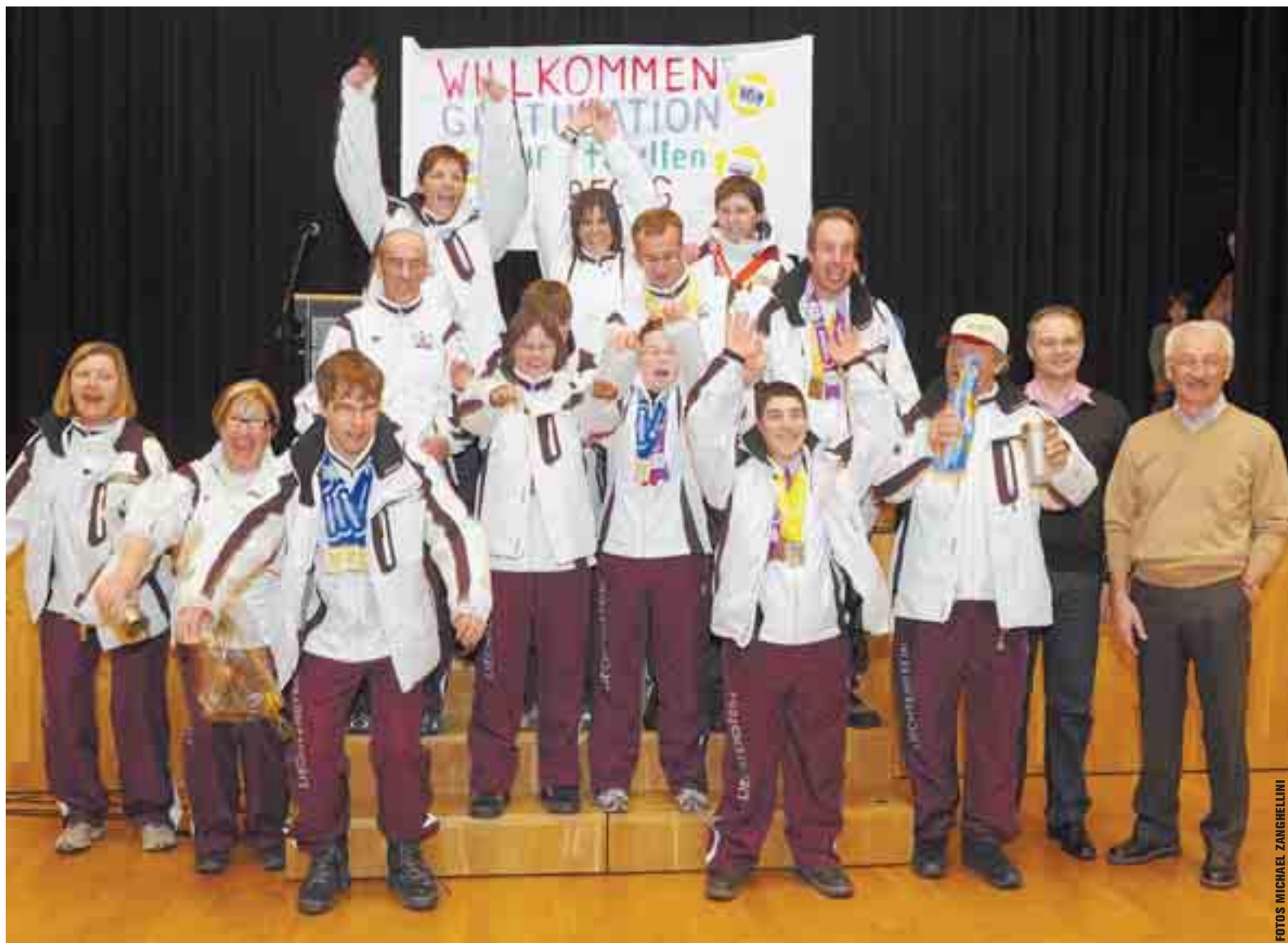
Liechtensteins Special-Olympics-Delegation wurde nach den erfolgreichen Tagen in den USA gestern in Balzers gebührend empfangen.

Erfolgreiche Liechtensteiner Special-Olympics-Athleten von Idaho in Balzers empfangen